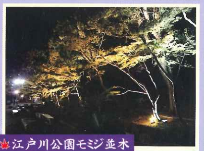
江戸川公園モミジ並木

※ 水神社、江戸川公園にはスタッフは居りません。マナーを守って静かにご覧ください。