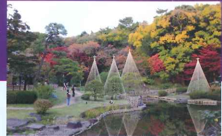
日中の庭園風景【11/19(土) 20(日) 26(土) 27(日) は 14:00より庭園ガイドツアーを開催します。】