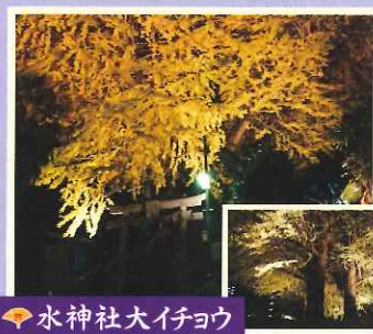
水神社大イチョウ